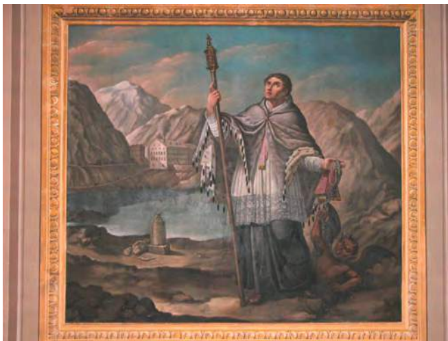
Fresque située dans la cathédrale d'Aoste représentant saint Bernard et l'Hospice.

Sur le versant valdôtain du Col, l'année jubilaire se prépare également